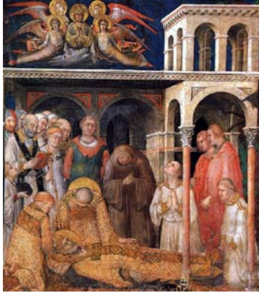
Simone Martini: esequie di S.Martino