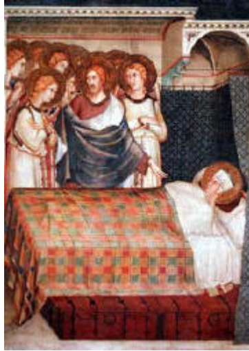
Simone Martini: Il sogno di s. Martino