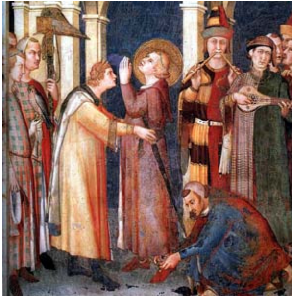
Simone Martini: Martino armato cavaliere