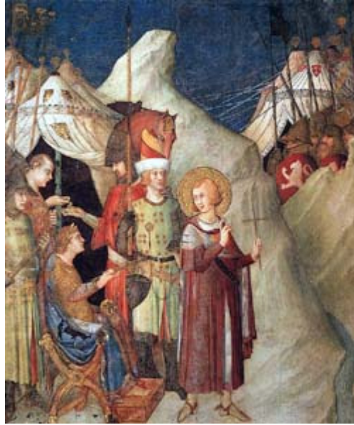
Simone Martini: S.Martino rinuncia alle armi