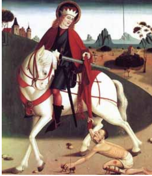
Anonimo ungherese (ca. 1490): s. Martino e il povero